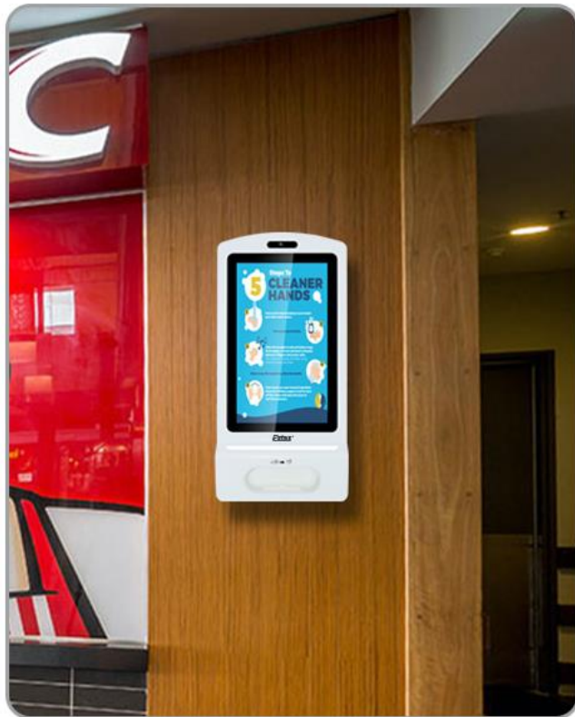
Montaje de Pared