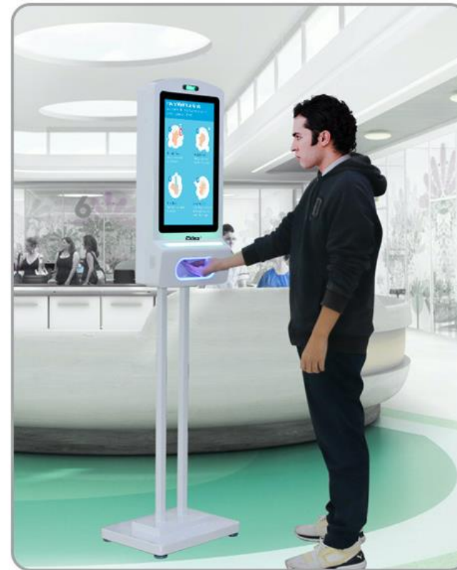
Montaje de Pie